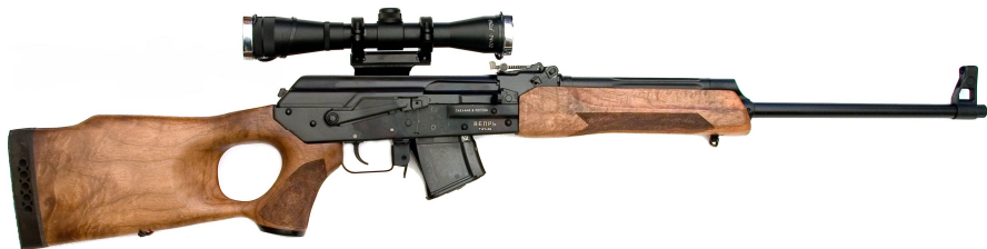
Рисунок 1- Карбин охотничий самозарядный модели «ВЕПРЬ» калибра 7,62x39, СОК-94

Карбин охотничий самозарядный модели «ВЕПРЬ» калибра 7,62x39 под охотничий патрон 7,62x39 предназначен для добычи объектов животного мира, отнесенных к объектам охоты, в рамках Постановления Правительства РФ № 18 от 10.01.09 г. в районах с умеренным и холодным климатом при температуре окружающей среды от минус 50 до плюс 50°С.