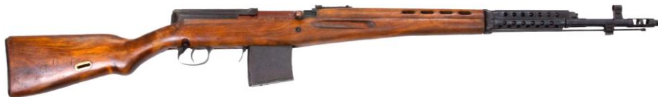
Рисунок 1 - Списанная учебная самозарядная 7,62-мм винтовка образца 1940г. системы Токарева (модель «ВПО-915»)

Списанная учебная самозарядная 7,62-мм винтовка образца 1940г. системы Токарева (модель «ВПО-915»), предназначена для использования в культурных и образовательных целях, без возможности имитации выстрела из него, для изучения процессов взаимодействия частей и механизмов оружия.