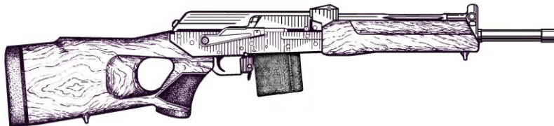
Рисунок 2- Карбин охотничий самозарядный модели «ВЕПРЬ» калибра 6,5х39, ВПО-128 -04; ВПО-128-05