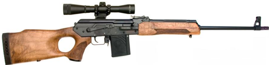
Рисунок 1- Карбин охотничий самозарядный модели «ВЕПРЬ» калибра 6,5x39(6,5Grendel), ВПО-128; ВПО-128-01; ВПО-128-02; ВПО-128-03.

Карбин охотничий самозарядный модели «ВЕПРЬ» калибра 6,5x39 (6,5Grendel) предназначен для добычи объектов животного мира, отнесенных к объектам охоты, в рамках Постановления Правительства РФ № 18 от 10.01.09 г. в районах с умеренным и холодным климатом при температуре окружающей среды от минус 50 до плюс 50°С.