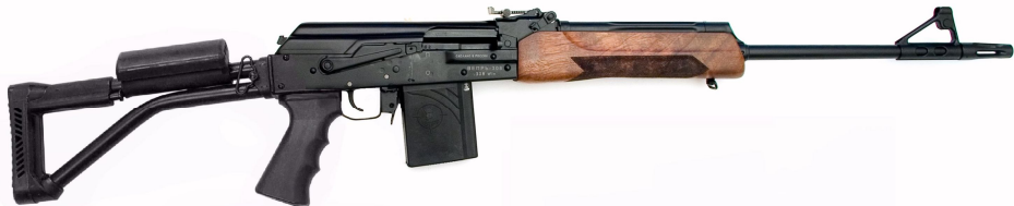
Рисунок 2 - Карабин охотничий самозарядный модели «ВЕРЬ-308» калибра .308 Win, СОК-95-03.