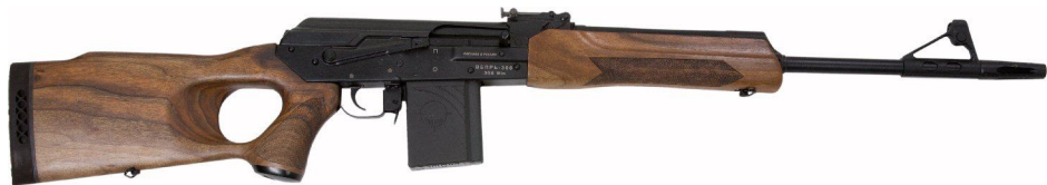
Рисунок 1 - Карабин охотничий самозарядный модели «ВЕПРЬ-308»

Карабин охотничий самозарядный модели «ВЕПРЬ-308» калибра .308 Win под охотничьи патроны 7,62x51 модернизированные и .308 Win (7,62x51) предназначен для добычи объектов животного мира, отнесенных к объектам охоты, в рамках Постановления Правительства РФ № 18 от 10.01.09 г. в районах с умеренным и холодным климатом при температуре окружающей среды от минус 50 до плюс 50°С.