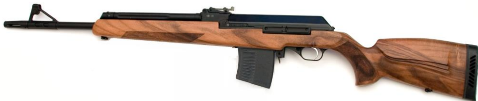
Рисунок 2 - Карабин охотничий самозарядный модели «ВЕПРЬ- ХАНТЕР » калибра 7,62x54R, ВПО-124М