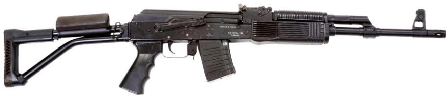
Рисунок 1 - Карабин охотничий с нарезным стволом самозарядный модели «Вепрь-1В» калибра .223Rem. (ВПО-125, ВПО-125-01)