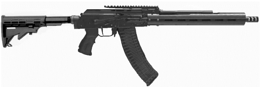
Рисунок 3 - Карабин охотничий с нарезным стволом самозарядный модели «Вепрь-1В» калибра .223Rem. (ВПО-125), в спортивном исполнении