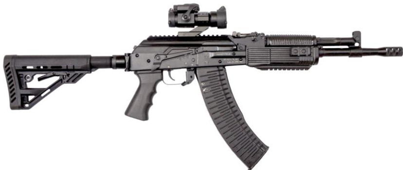
Рисунок 2 - Карбин охотничий с нарезным стволом самозарядный модели «Вепрь-1В» калибра 5,45х39 (ВПО-148-05; ВПО-148-06; ВПО-148-07; ВПО-148-08; ВПО-148-09).