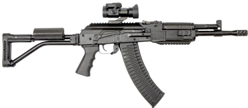
Рисунок 1 - Карбин охотничий с нарезным стволом самозарядный модели «Вепрь-1В» калибра 5,45х39 (ВПО-148; ВПО-148-01; ВПО-148-02; ВПО-148-03; ВПО-148-04).

Карбин охотничий с нарезным стволом самозарядный модели «Вепрь-1В» калибра 5,45х39 представлен следующими исполнениями (рис.1, 2): Внешний вид может меняться в зависимости от комплектации