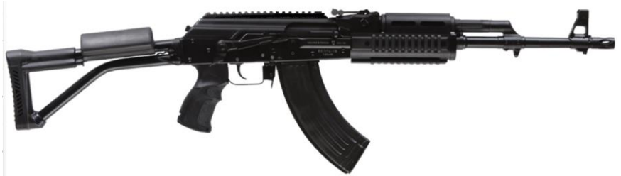
Рисунок 1 – Карбин охотничий самозарядный модели «Вепрь-1В» калибра 7,62x39, (ВПО-156-19; ВПО-156-20; ВПО-156-21; ВПО-156-22; ВПО-156-23)

Карбин охотничий самозарядный модели «Вепрь-1В» калибра 7,62x39 представлен следующими исполнениями (рис.1, 2):