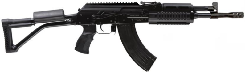
Рисунок 2 – Карбин охотничий самозарядный модели «Вепрь-1В» калибра 7,62x39, (ВПО-156-18)