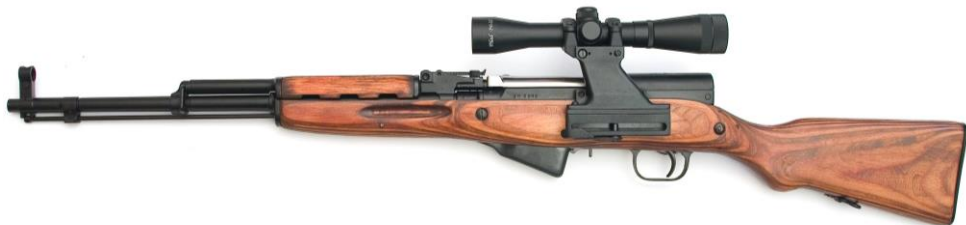
Рисунок 1 – Общий вид карабина охотничьего самозарядного модели ОП-СКС калибра 7,62x39, с оптическим прицелом.

ший дефектацию и доработанный до соответствия требованиям ОП-СКС ТУ 7185-033-7514245-96.