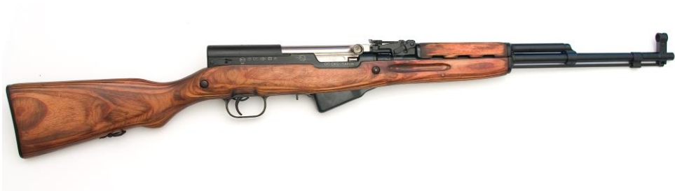
Рисунок 2 – Общий вид карабина охотничьего самозарядного ОП-СКС калибра 7,62x39

ВНИМАНИЕ! В КАНАЛЕ СТВОЛА УСТАНОВЛЕН ОПОЗНАВА- ТЕЛЬНЫЙ ЭЛЕМЕНТ, НАЛИЧИЕ КОТОРОГО ОБЯЗАТЕЛЬНО.