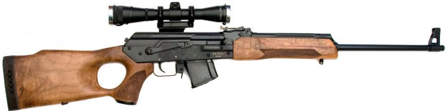
Рисунок 1- Карабин охотничий самозарядный модели «Вепрь» калибра 7,62x39, СОК-94